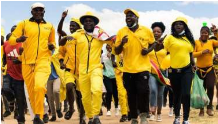
Aanhangers van de partij Citizens

geweigerd om Zimbabwanen die in het buitenland wonen te laten stemmen - wat ook in het nadeel van de heer Chamisa kan werken.