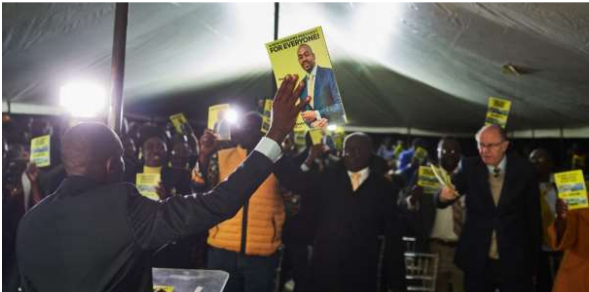
Nelson Chamisa, leider van de belangrijkste oppositiepartij van Zimbabwe, Citizens Coalition for Change, spreekt afgevaardigden toe tijdens de lancering van het manifest in Bulawayo op 8 augustus 2023.

Zijn de CCC en het maatschappelijk middenveld niet alleen in staat om te gaan stemmen, maar ook om ervoor te zorgen dat er geen manipulatie plaatsvindt bij het tellen en doorgeven van de stemmen door de Zimbabwaanse verkiezingscommissie (ZEC)? Gezien al deze uitdagingen is het meer dan verbazingwekkend dat er in de gelederen van de oppositie een optimistische stemming heerst aan het begin van het laatste weekend.