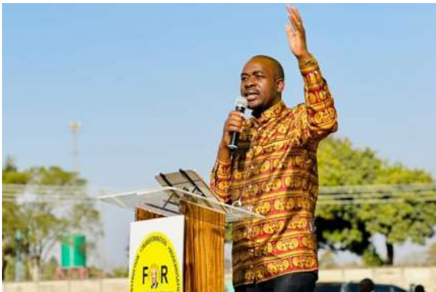
Burgercoalitie voor Verandering leider Nelson Chamisa tijdens een bijeenkomst in Chipinge, Zimbabwe, in 2018.

Kasukuwere, die op het hoogtepunt van de militaire coup die Robert Mugabe tot aftreden dwong, in ballingschap naar Zuid-Afrika werd gestuurd, redeneerde dat de bevestiging van de beslissing van het Hooggerechtshof door het Hooggerechtshof de democratische principes ondermijnde. Het Hooggerechtshof gaf geen redenen voor zijn uitspraak. "Het is verbijsterend hoe het Hooggerechtshof tot de conclusie is gekomen dat ik niet mag deelnemen aan verkiezingen waarbij het volk centraal staat en die nooit door de rechterlijke macht mogen worden gecontroleerd", voegde hij eraan toe.